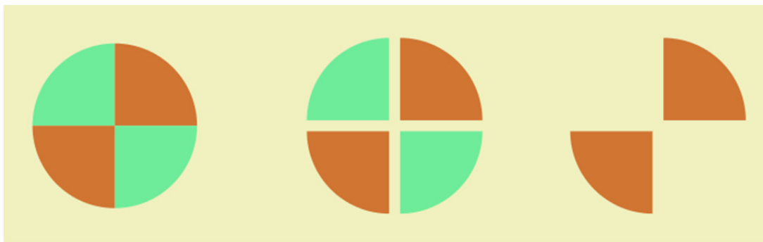
Slika 1: Grafični prikaz metode mešanja in deljenja vzorca s četrтinjenjem

Zbirni vzorec odpadkov je treba s postopkom deljenja vzorca na čedalje manjše dele zmanjševati tako dolgo, dokler se ne pridobi reprezentativni vzorec. To se naredi tako, da se zbirni vzorec razgrne na ravno, utrjeno in za tekočine neprepustno površino. Odpadki se stresejo na kup in se oblikujejo v stožec, nato pa se ta stožec s tako imenovano metodo mešanja in deljenja vzorca s četrтинjenjem po sredini razdeli na štiri približno enake dele. Dve nasprotni četrтini se odstranita, preostali dve pa se združita in zmešata. Znova se naredi stožec. Postopek se ponavlja tako dolgo, dokler preostali četrтini ne ustrežata količini mešanega komunalnega odpadka v reprezentativnem vzorcu.