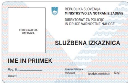
Sprednja stran identifikacijske izkaznice

Na sprednji strani so podatki natisnjeni v črni barvi. Grb Republike Slovenije je moder, v barvnem sistemu Pantone 549. Linije v podlagi so modre in rdeče barve.