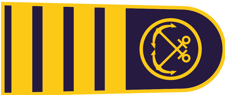
EPOLETA inšpektor in vodja oddelka