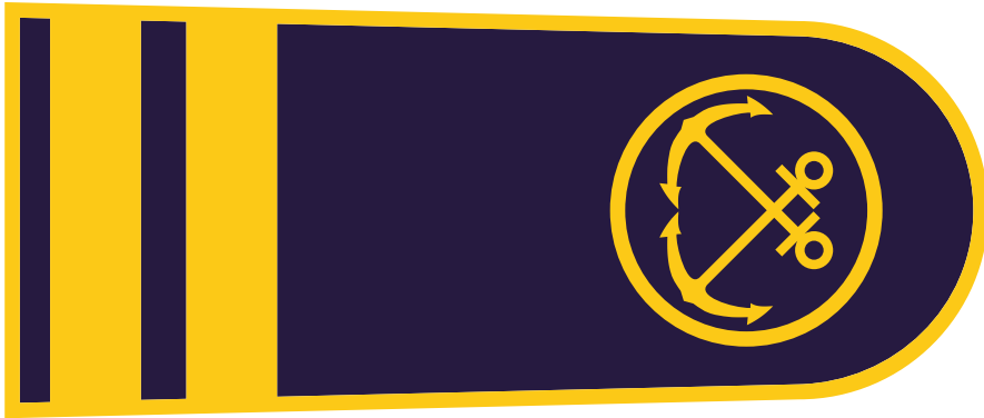
EPOLETA pristaniški nadzornik