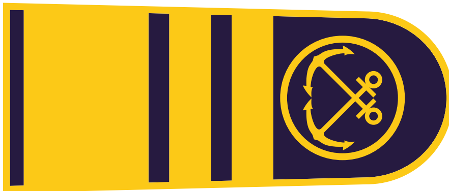
EPOLETA - predstojnik Uprave