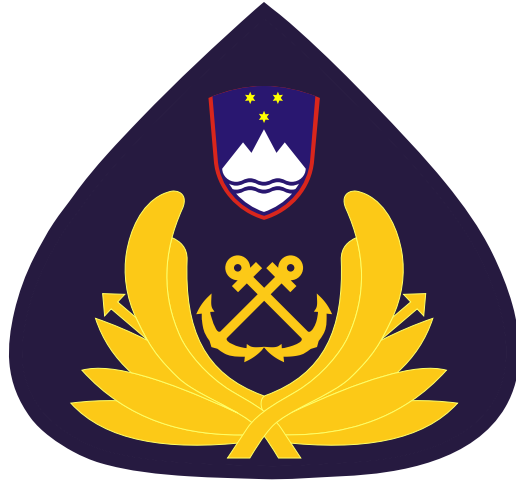
TRIOGLATI EMBLEM - VELIKI