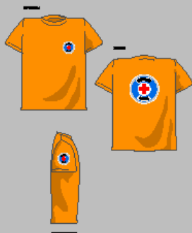
Majica s kratkimi rokavi