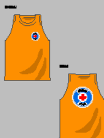
Majica brez rokav