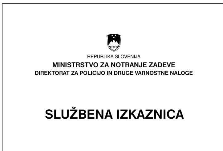
SPREDNJA STRAN ETUIJA