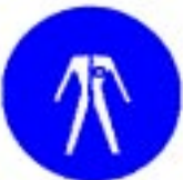
Obvezna uporaba zaščitnega kombinezona