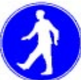
Obvezna pot za pešce