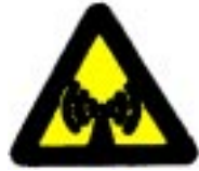
Neionizirajoče sevanje !