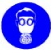
Obvezna uporaba respiratorja