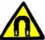
Močno magnetno polje