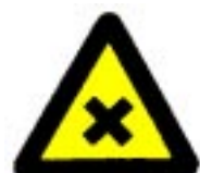
Škodljiva in dražeča snov