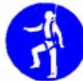
Obvezna uporaba varnostnega pasu