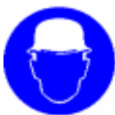
Obvezna uporaba varnostne čelade