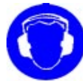
Obvezna uporaba zaščite ušes