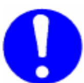
Splošen znak za obveznost (biti mora dopolnjen z drugim znakom)