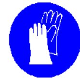
Obvezna uporaba zaščitnih rokavic