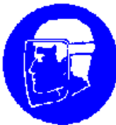
Obvezna uporaba ščitnika obraza