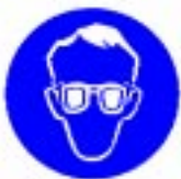
Obvezna zaščita oči

- bel piktoogram na plavi podlagi (plava barva mora zavzemati najmanj 50 % površine znaka).