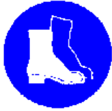
Obvezna uporaba zaščitnih škornjev