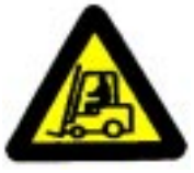
Pozor! Industrijska vozila