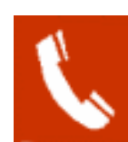
Telefon za javljanje požara