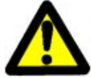
Pozor! Splošna nevarnost