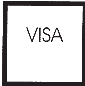
Fahrspur für sonstige Drittstaatsangehörige