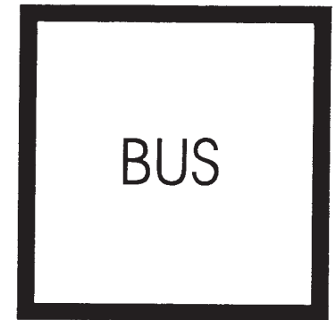
Fahrspur für Autobusse