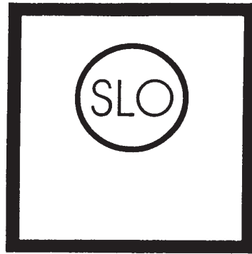
Fahrspur für die slowenischen Staatsangehörigen