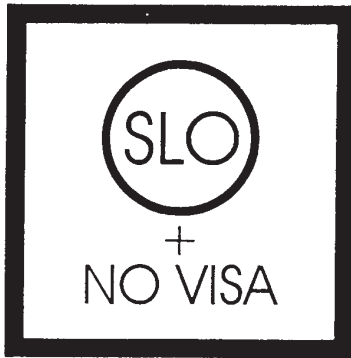
Fahrspur für slow. Staatsangehörige und für Staatsangehörige, die weder in der Republik Österreich noch in der Republik Slowenien der Sichtvermerkplicht unterliegen