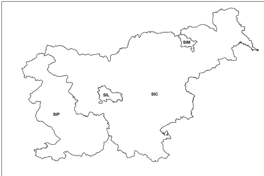
Slika 2: Karta območij in aglomeracij v Republiki Sloveniji glede na svinec, arzen, kadmij in nikelj