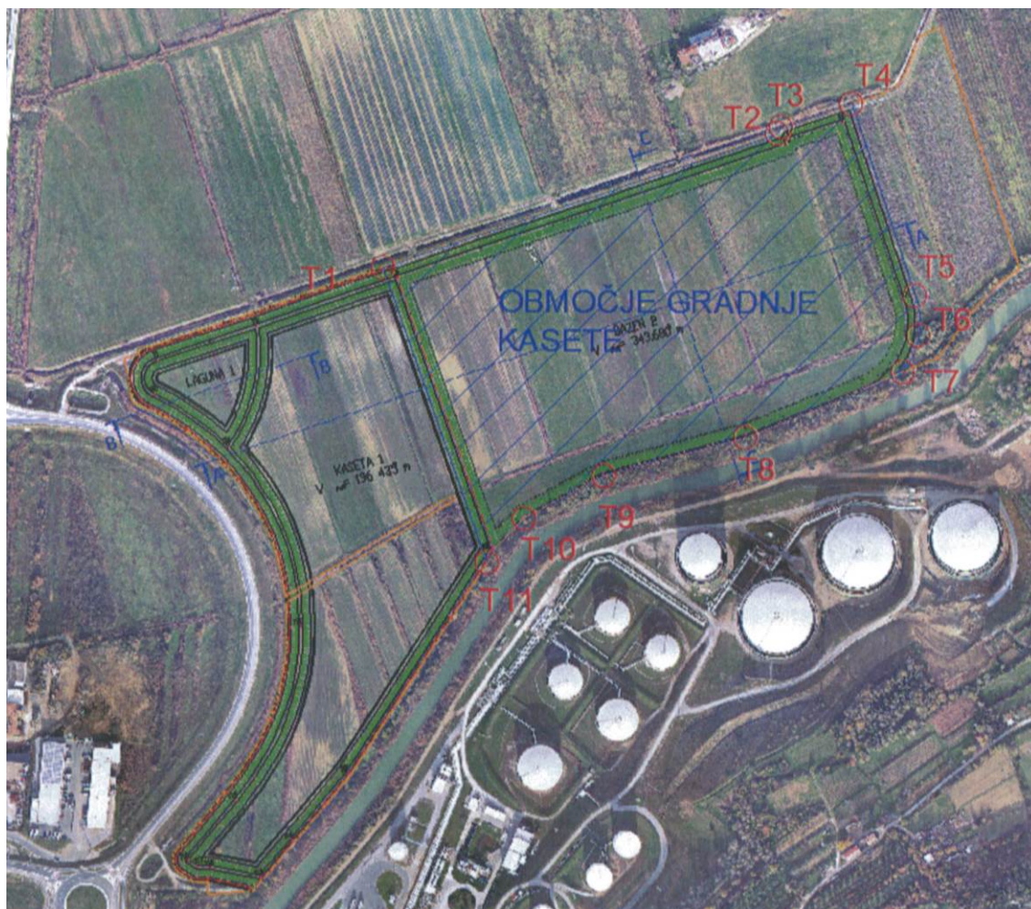
Koordinate spremembe območja koprskega tovornega pristanišča iz Priloge 1