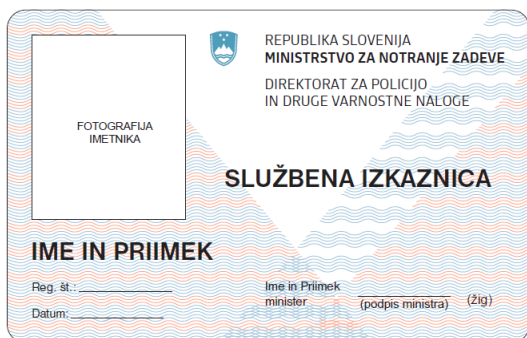
Sprednja stran identifikacijske izkaznice

Na sprednji strani so podatki natisnjeni v črni barvi. Grb Republike Slovenije je moder, v barvnem sistemu Pantone 549. Linije v podlagi so modre in rdeče barve.