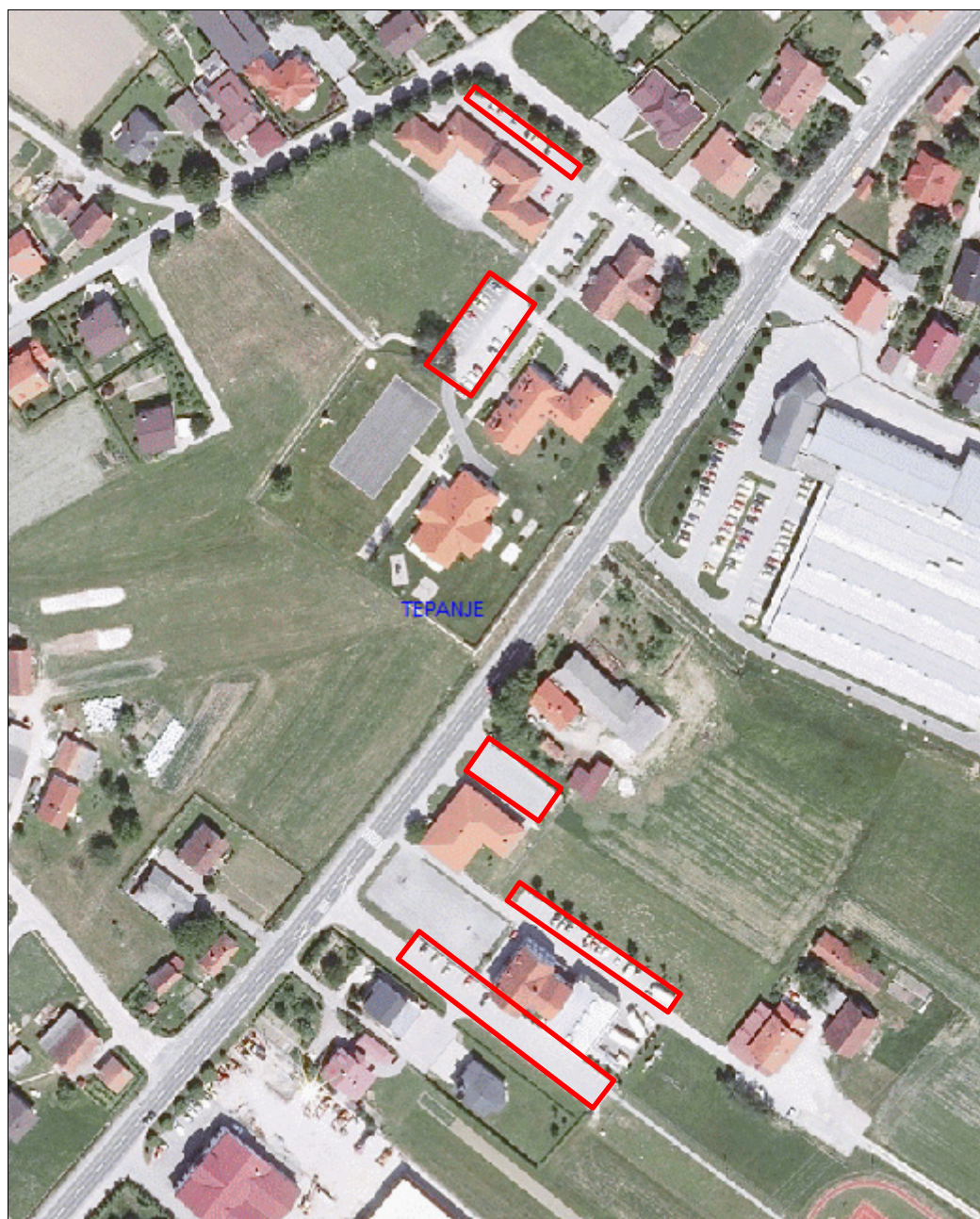
Slika 3: Območje con kratkotrajnega parkiranja v naselju Tepanje