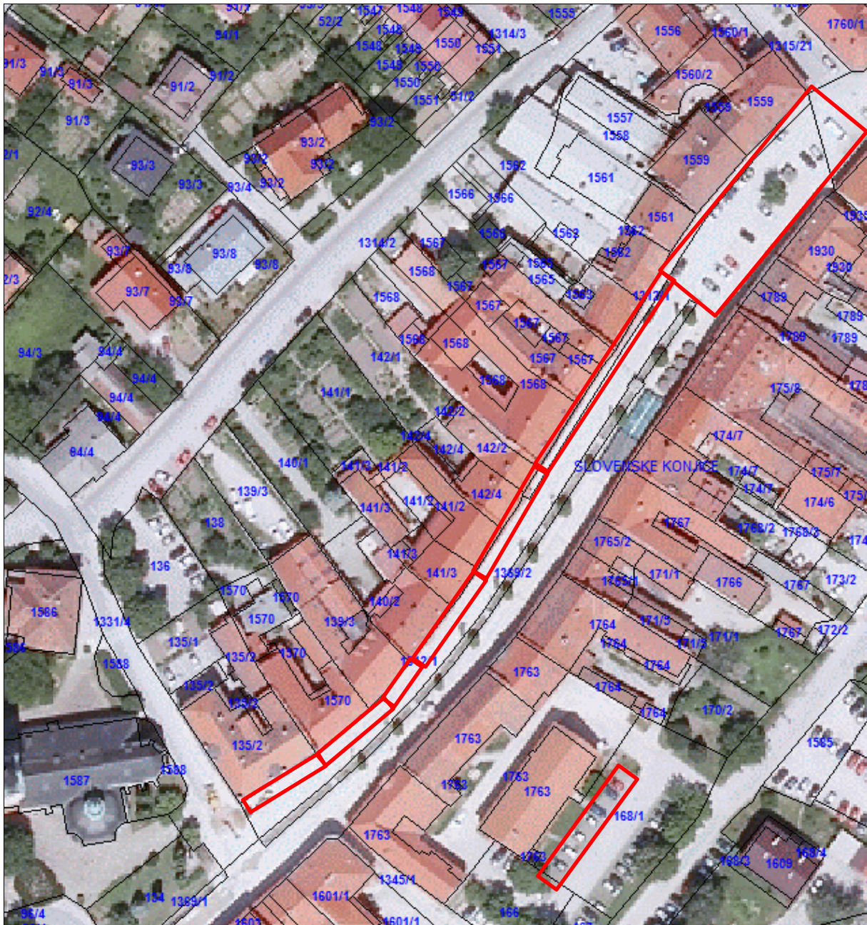
Slika 1: Območje Starega trga in parkirišča za Upravno enoto